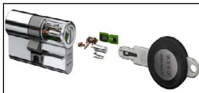
Système Keso ecliq

Le système ecliq est intéressant en raison de sa configuration : le cylindre contient des composants électroniques ne nécessitant aucune alimentation électrique ; la clé alimente, par sa pile, le cylindre et donne l'information au cylindre de l'attribution d'accès ou non ; la clé est (re)programmable à volonté et offre la souplesse en cas de besoin pour être réaffectée à un autre groupe d'utilisateurs ou de bâtiments, ceci moyennant une reprogrammation depuis une console connectée à un PC ; enfin, le passage au cylindre tel que proposé ne nécessite aucune transformation des portes et s'intègre à l'emplacement des cylindres existants.